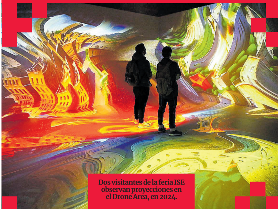
Dos visitantes de la feria ISE observan proyecciones en el Drone Area, en 2024.